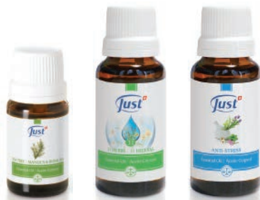
Aceite Esencial de Tea Tree, Manuca & Rosalina

¡Utiliza también los Vehiculares Aromablends con nuestras sinergias de Aceites Esenciales que ya vienen preparadas!